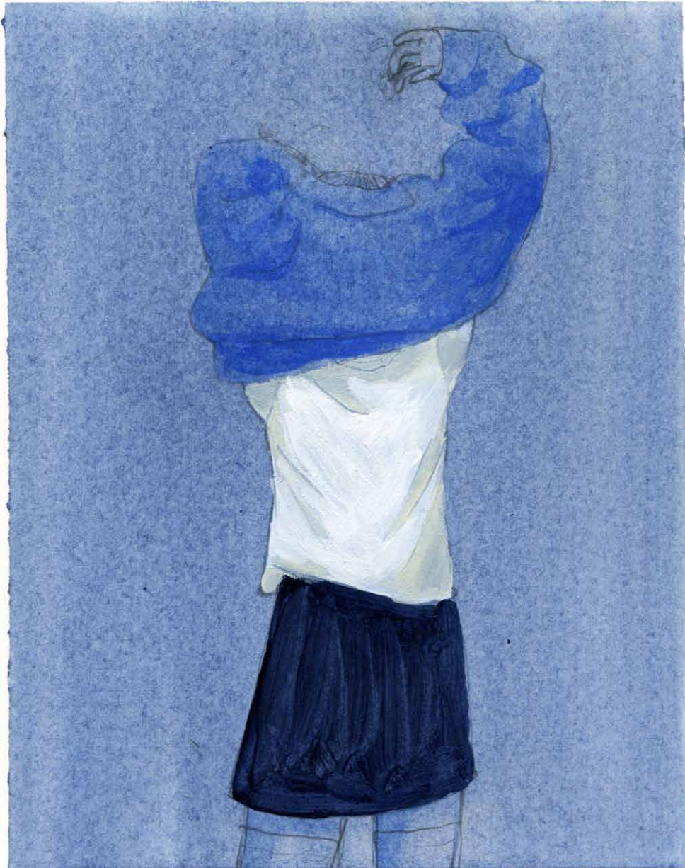
A confused hand.